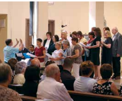
Premiere des Caritas-Chors in der Kirche St. Vitus.