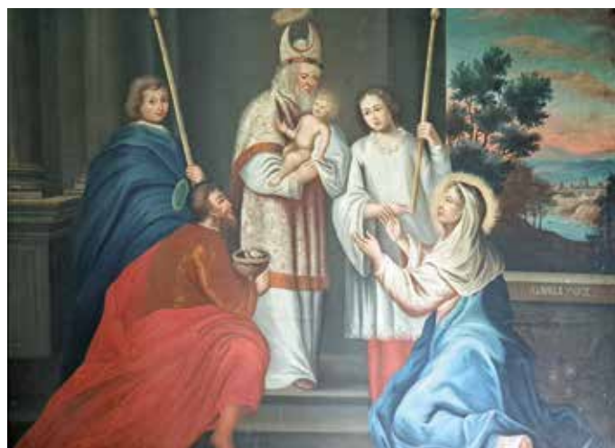
Darstellung des Herrn im Tempel zu Jerusalem