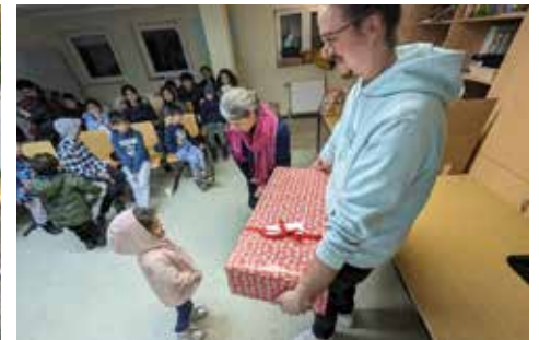
Die Unterkunft für Geflüchtete in der Hardtstraße und zwei Schnapsschüsse aus der Caritas-Arbeit mit geflüchteten Menschen.

Kooperationspartner immer wieder mit drohenden Mittelkürzungen durch die öffentliche Hand konfrontiert. Diese Unsicherheiten stellen eine Herausforderung dar, doch wir bleiben entschlossen, allen Menschen, die Rat und Unterstützung suchen, zur Seite zu stehen. Die Fachdienste der Caritas sind darauf spezialisiert, komplexe rechtliche Fragestellungen zu klären und individuelle Fallkonstellationen zu bearbeiten. Oftmals stehen die Betroffenen auch vor finanziellen Hürden, sei es bei der Beschaffung von Pässen, der Übersetzung von Dokumenten oder dem Zugang zu grundlegenden Lebensbedürfnissen.