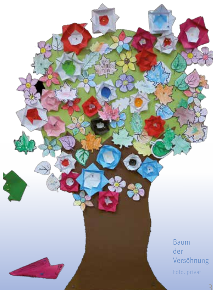
Baum der Versöhnung