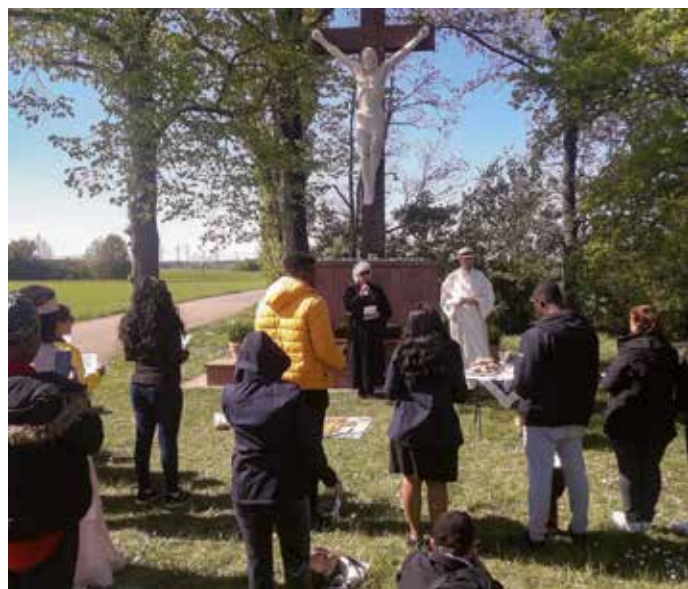
Ostergottesdienst am Friedenskreuz 2022

KONTAKT Stiftung Heidelberger Friedenskreuz c/o Pfarramt St. Peter, Lochheimer Str. 39, 69124 Heidelberg | INFO@FRIEDENSKREUZ-HEIDELBERG.DE