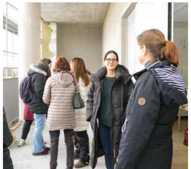
Im Caritashaus Katharina Labouré gehört zu jeder der acht Wohngruppen für jeweils 15 Personen eine große Wohnküche plus Wohnzimmerbereich (Bild links) sowie eine Loggia mit Blick Richtung Neckar und Innenstadt (rechts).