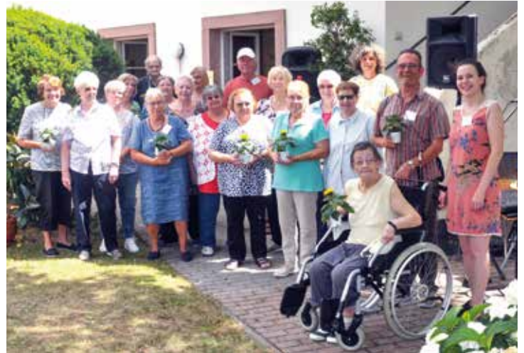
Sonnenblumen gab es für die vielen ehrenamtlich Tätigen, ohne die die Angebote des Seniorenzentrums nicht möglich wären.