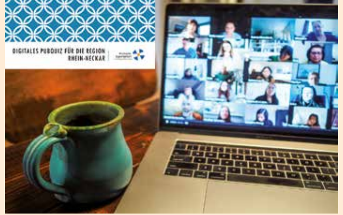
Collage: Andrea Becker